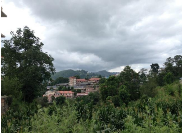
Blick auf das Klinik- Gelände