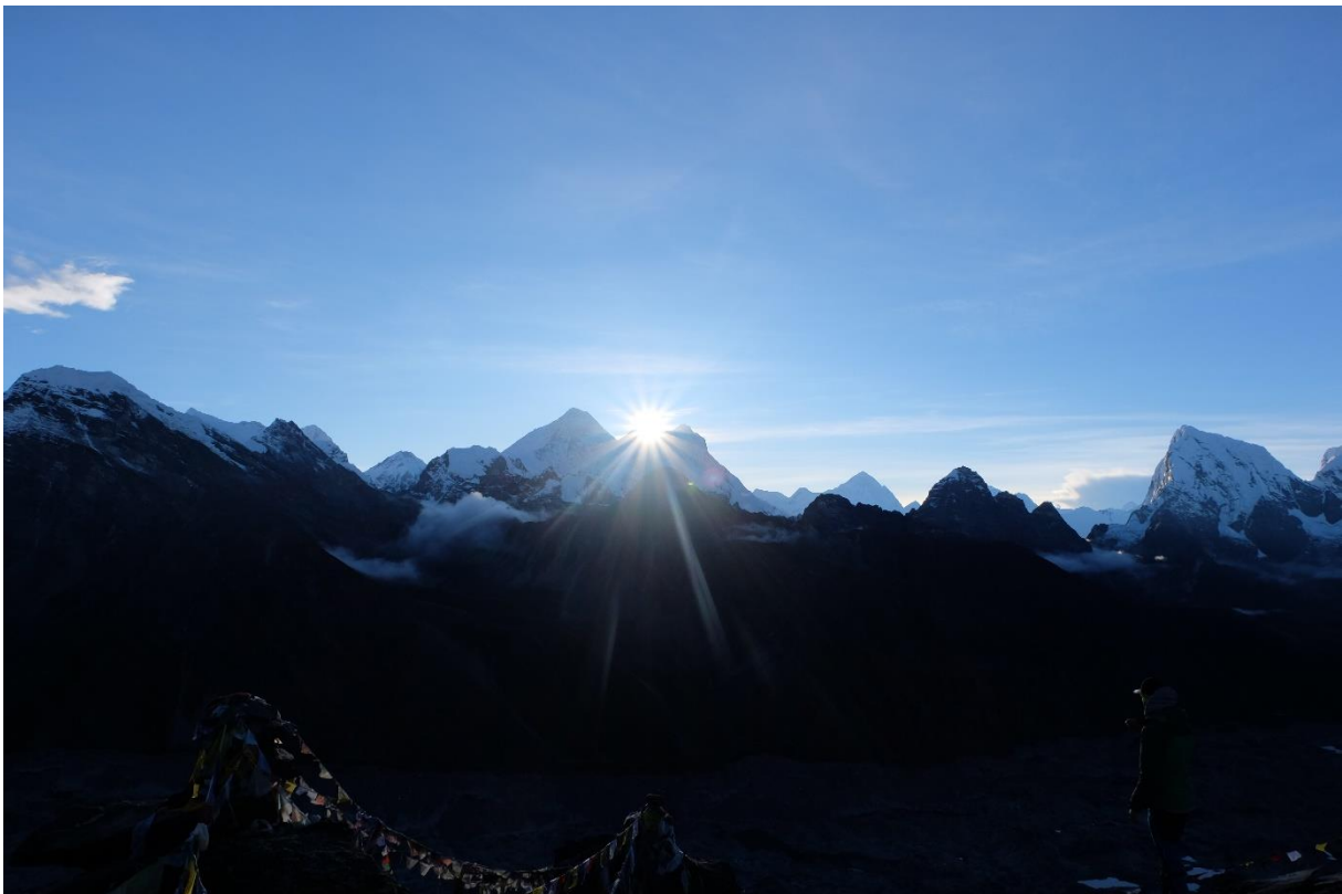
Gokyo Ri: Sonnenaufgang über Mt. Everest