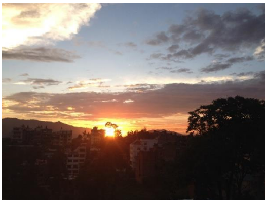
Sonnenuntergang von der Dachterrasse aus

Bezüglich der Unterkunft hat jeder 2 Möglichkeiten. Im Guideline des Krankenhauses, den man zugesendet bekommt ist eine Unterkunft des Krankenhauses wie folgt erwähnt: International Guesthouse. 550 NRs für die Übernachtung pro Tag, zusätzlich 200 NRs für das Essen. (Infos aus dem Guideline, Stand: 2018). Die zweite Möglichkeit, für welche ich mich auch entschieden habe, ist Sharmilas Paradise Guesthouse. Dieses liegt ungefähr 10 Minuten zu Fuß vom Krankenhaus entfernt und bieten verschiedene Zimmer mit unterschiedlichen Preisen an. Man kann sich zwischen einem Einzelzimmer, Zweierzimmer oder eventuell auch Dreierzimmer entscheiden. Ich habe mich für ein Einzelzimmer entschieden und pro Nacht 1100 NRs bezahlt, zusätzlich für Frühstück und Abendessen jeweils 200 NRs. Wobei ich noch den alten Preis bezahlt habe. Zurzeit zahlt man jeweils 250NRs pro Essen. Ich persönlich habe meine Entscheidung mit der Unterkunft nie bereut. Mein Einzelzimmer war