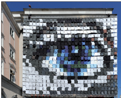
KUNSTUNIVERSITÄT LINZ (EYECATCHER – FASSADENGESTALTUNG ZUM TAG DER OFFENEN TÜR 2010)

können Lehrveranstaltungskategorien gebildet werden. Dabei darf