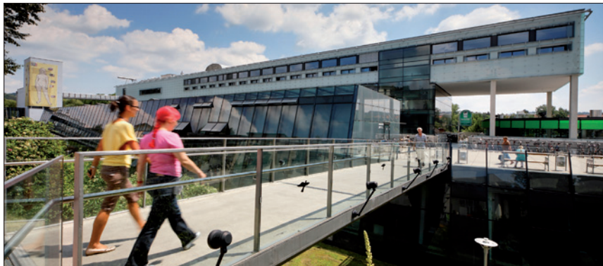
ZENTRUM FÜR MEDIZINISCHE FORSCHUNG (ZMF) DER MEDIZINISCHEN UNIVERSITÄT GRAZ