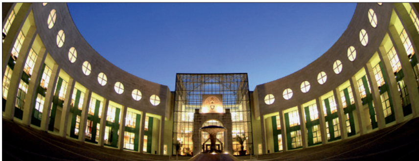
UNIVERSITÄT SALZBURG / © Scheinast

(9) Beiträge nach Abs. 1, 3 und 5 sind im Falle des § 49 Abs. 14 nur insoweit zu leisten, als das Entgelt gemäß Abs. 2 die Bezüge eines/einer freigestellten Universitätslehrers/Universitätslehrerin (zuzüglich Zuwendungen gemäß § 155 Abs 4 BDG 1979, § 240a BDG 1979 und § 9 BB-SozPG) im Sinne des § 49 Abs. 14 übersteigt.