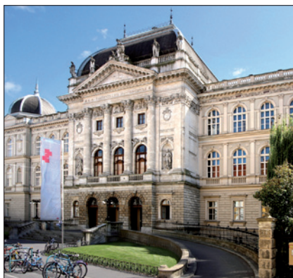
TECHNISCHE UNIVERSITÄT GRAZ, HAUPTGEBÄUDE, ALTE TECHNIK

(8) Das Urlaubsausmaß nach Abs. 1, 7 und 7a erhöht sich für ArbeitnehmerInnen, deren Zugehörigkeit zum Kreis der begünstigten Behinderten nach § 14 Abs. 1 oder 2 Behinderteneinstellungsgesetz festgestellt ist oder die eine Rente wegen Minderung der Erwerbsfähigkeit als Folge eines Arbeits/Dienstunfalls