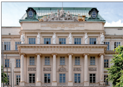
TECHNISCHE UNIVERSITÄT WIEN, HAUPTGEBÄUDE

(2) Haben ArbeitnehmerInnen unverfallbare Anwartschaften erworben, haben sie bei Beendigung des Arbeits- oder Ausbildungsverhältnisses vor Eintritt des Leistungsfalls Anspruch auf den Unverfallbarkeitsbetrag. Dieser entspricht 100 % der dem/der Anwartschaftsberechtigten zum jeweiligen Austritts- stichtag zugeordneten Deckungsrückstellung. Anwartschaftsberechtigte können über den Unverfallbarkeitsbetrag nach § 5 Abs. 2 und 3 BPG verfügen.