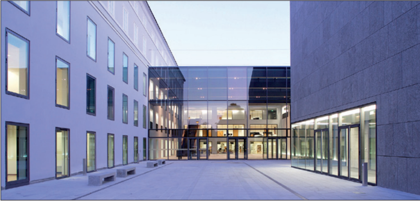
UNIVERSITÄT MOZARTEUM SALZBURG