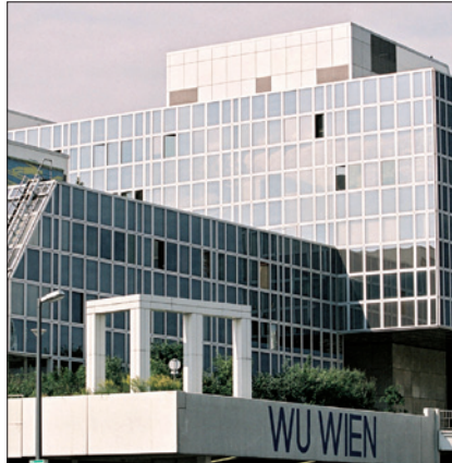
WIRTSCHAFTSUNIVERSITÄT WIEN

(1) Der/die ArbeitnehmerIn ist zu regelmäßiger Fortbildung verpflichtet und hat an von der