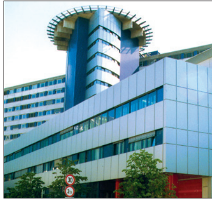
MEDIZINISCHE UNIVERSITÄT INNSBRUCK, CHIRURGIE

(1) Dem/der ArbeitnehmerIn, der/die durch Erklärung bei der Universität einen Pauschbetrag gemäß § 16 Abs. 1 Z 6 lit. c, d oder e EStG