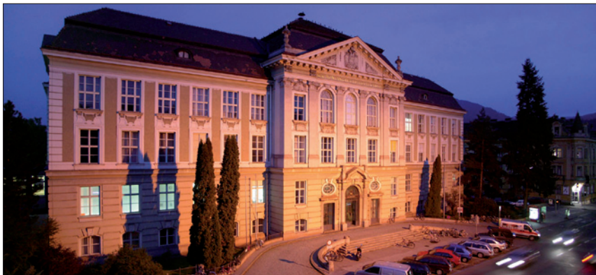
MONTANUNIVERSITÄT LEOBEN / © Montanuniversität/Freisinger

hen sich in dem Maß, das sich aus der Veränderung des von der Bundesanstalt Statistik Österreich verlaublichen Verbraucherpreisindex 2010 oder des an seine Stelle tretenden Index gegenüber der für September 2012 verlaublichen Indexzahl ergibt, wobei Änderungen solange nicht zu berücksichtigen sind, als sie 5% dieser Indexzahl und in der Folge 5% der zuletzt für die Valorisierung maßgebenden Indexzahl nicht übersteigen. Die neuen Beträge gelten ab dem der Verlaublichen der Indexveränderung durch die Bundesanstalt Statistik Österreich folgenden übernächsten Monatsersten. Maßgebend sind die durch Verordnung des Bundeskanzlers kundgemachten durch die Valorisierung geänderten Beträge einschließlich des Zeitpunkts, in dem deren Änderung wirksam wird.