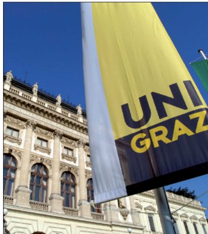
KARL-FRANZENS-UNIVERSITÄT GRAZ

(2) Der/die UniversitätsprofessorIn hat nach Maßgabe des Arbeitsvertrages insbesondere 1. dieses Fach in Forschung/Entwicklung und Erschließung der Künste und Lehre zu vertreten und zu fördern sowie sich an der Erfüllung der Forschungsaufgaben/Entwicklung und Erschließung der Künste der Organisationseinheit, der er/sie zugeteilt sind, zu beteiligen;