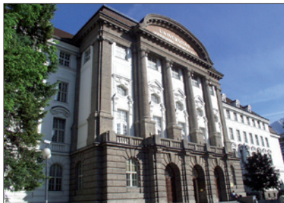
UNIVERSITÄT INNSBRUCK / © Universität Innsbruck

(2) Für ArbeitnehmerInnen, die nach §§ 26 Abs. 2 letzter Satz oder 28 bzw. § 50 Abs. 2 einzustufen sind und deren Arbeitsvertrag