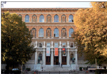
AKADEMIE DER BILDENDEN KÜNSTE WIEN

soweit für diese Zeiten nicht die Abgeltung durch Zeitausgleich erfolgt.