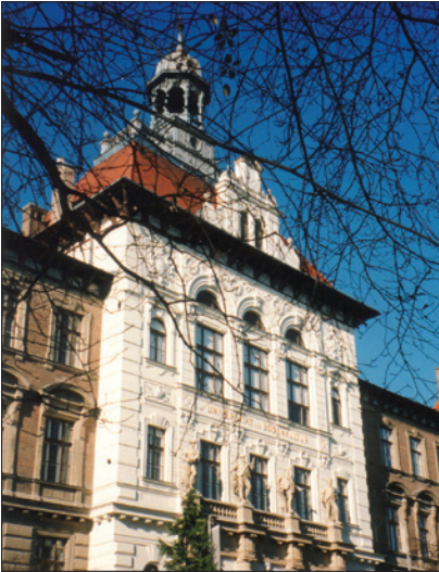
UNIVERSITÄT FÜR BODENKULTUR, MENDEL HAUS

die im Klinischen Bereich einer Medizinischen Universität ärztlich oder zahnärztlich verwendet werden, erhöht sich diese Zulage für die Dauer der Wirksamkeit einer Betriebsvereinbarung gemäß § 3 Abs. 4 und § 4 KA-AZG (§ 40 Abs. 7 und 8), mit der das Funktionieren des Krankenanstaltenbetriebes (§ 37 Abs. 1) gewährleistet ist, auf monatlich 22,5 % des monatlichen Bruttoentgeltes der Verwendungsgruppe IIIb/ Regelstufe 1 (§ 54). Bei Teilzeitbeschäftigung gebührt die Zulage aliquot.