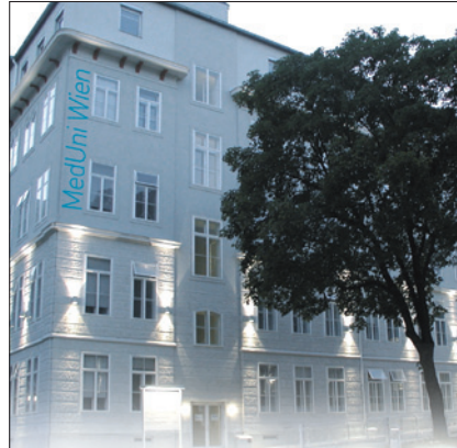
MEDIZINISCHE UNIVERSITÄT WIEN / © MedUni Wien

(4) Der/die ArbeitnehmerIn ist verpflichtet, die geleisteten Mehrarbeitsstunden oder Überstun-