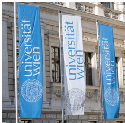
UNIVERSITÄT WIEN, HAUPTPORTAL